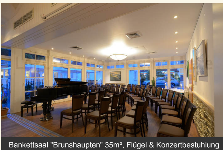
Bankettsaal "Brunshaupten" 35m 2 , Flügel & Konzertbestuhlung

Die Tagungs- und Festräume haben eine 2000W Beschallungsanlage. Der "Blüthner" Konzertflügel ist beweglich und kann, je nach Bedarf, entsprechend platziert werden. Oft werden "Arendsee" & "Brunshaupten" gemeinsam genutzt, so z.B. für Tanz auf der einen und für kalt/warmes Buffet auf der anderen Seite. Tagungstechnik aller Art vorhanden. Die Beleuchtung kann, je nach Verwendungszweck, exakt ausgerichtet und eingestellt werden. Die Leinwand ist fest installiert.