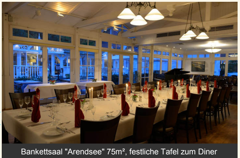
Bankettsaal "Arendsee" 75m 2 , festliche Tafel zum Diner

Das Ensemble "Arendsee", "Brunshaupten" und "Bülow's GartenLounge" ist für die Ausrichtung von Familienfeierlichkeiten aller Art, Tagungen, Workshops, Konferenzen, Vernissagen, Lesungen und Konzerten prädestiniert. Auf 35m 2 bis max. 110m 2 können Gesellschaften von 6 bis 90 Personen, je nach Bestuhlung, Feiern oder Tagen. Alle Räumlichkeiten verfügen über große, abdunkelbare Glasfronten, die bei Bedarf nach Aussen geöffnet werden können.