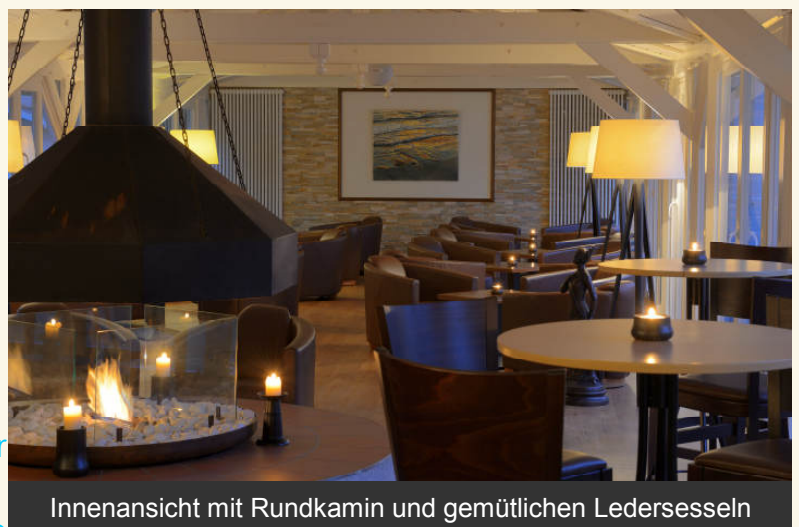
Innenansicht mit Rundkamin und gemütlichen Ledersesseln

Im Jahre 2011 entstanden aus dem 1996 im Bäderstil errichteten, offenen "Grillarium", bietet unsere Cocktail-Lounge und Bar, die auch 2013 mit 100 versch. Sorten wieder zu einer der besten Whisky-Bars Deutschlands gekürt wurde, ein entspannendes, gediegenes Ambiente zum lockeren Verweilen bei kühlem Drink, entspannter Musik und ggf. einer guten Zigarre. Ob zum totalen Relaxen oder auch zum angeregten Pläuschchen unter Freunden und Kollegen, Bülow's