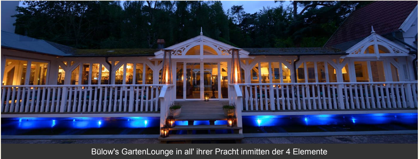
Bülow's GartenLounge in all' ihrer Pracht inmitten der 4 Elemente

Im Jahre 2011 entstanden aus dem 1996 im Bäderstil errichteten, offenen "Grillarium", bietet unsere Cocktail-Lounge und Bar, die auch 2013 mit 100 versch. Sorten wieder zu einer der besten Whisky-Bars Deutschlands gekürt wurde, ein entspannendes, gediegenes Ambiente zum lockeren Verweilen bei kühlem Drink, entspannter Musik und ggf. einer guten Zigarre. Ob zum totalen Relaxen oder auch zum angeregten Pläuschchen unter Freunden und Kollegen, Bülow's