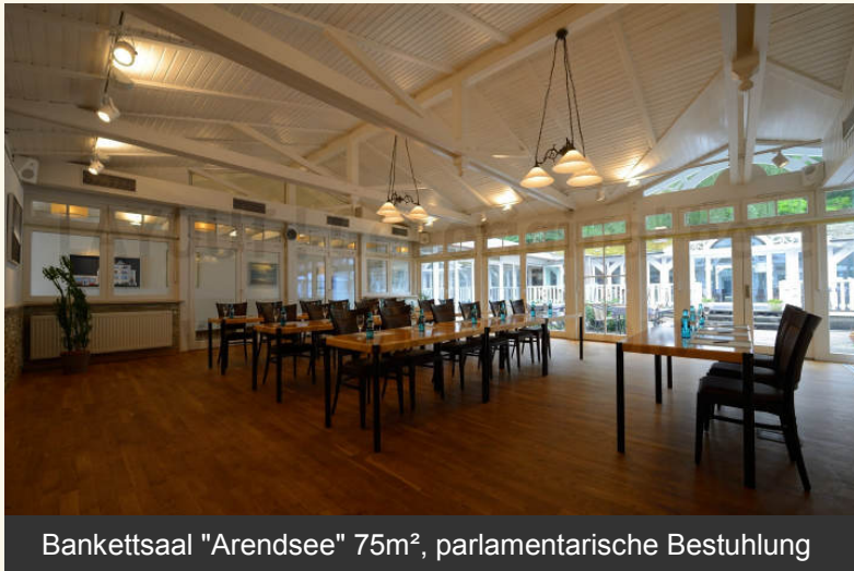
Bankettsaal "Arendsee" 75m 2 , parlamentarische Bestuhlung

Seit letztem Umbau und Generalüberholung im Jahre 2012 ist das Hotel "Polar-Stern" in der Lage, große Tagungen und Feierlichkeiten auszurichten. Hierfür stehen die Bankettsäle "Arendsee" und "Brunshaupten", die im Bedarfsfall durch Schiebetür entweder getrennt oder vereint werden können, zur Verfügung. Garten und GartenLounge komplettieren das umfangreiche und sehr flexible Angebot an Räumlichkeiten.